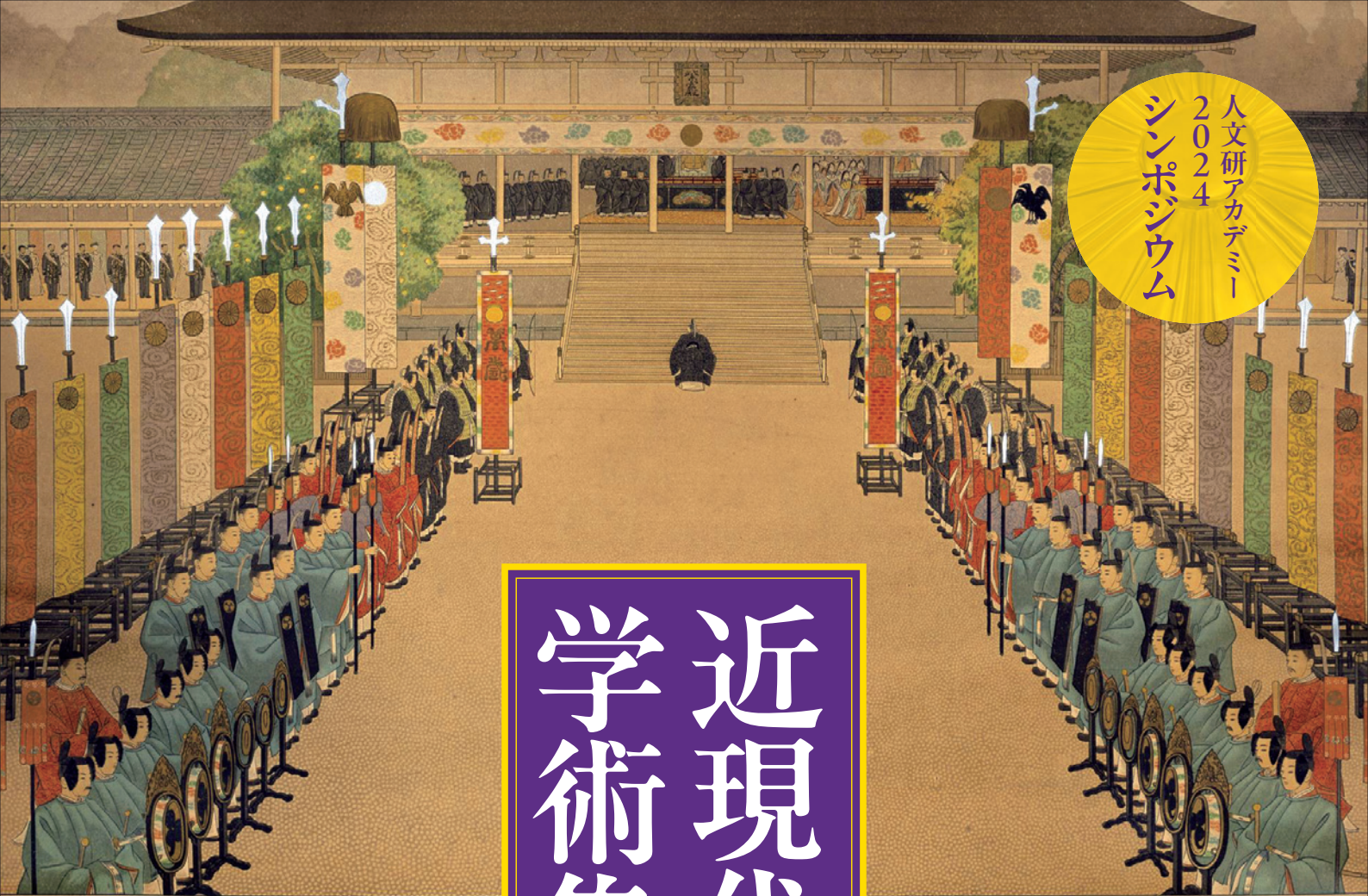
『御即位大礼掛圖 大正御即位紫宸殿之儀』(京都大学吉田南総合図書館所蔵)