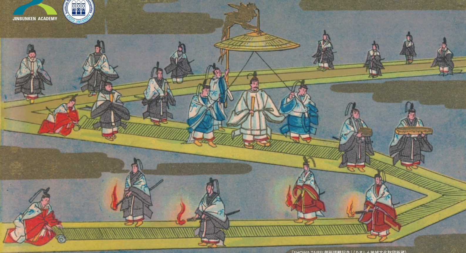
「SHOWA TAIREI 御所拝観記念」(たましん地域文化財団所蔵)